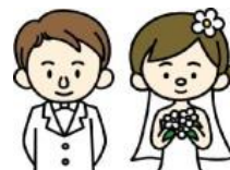
扶養していない娘夫婦