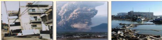
地震による倒壊 阪神・淡路大震災1995年 (日本損害保険協会提供) 噴火による災害 有珠山噴火2000年 (日本損害保険協会提供) 津波による災害 東日本大震災2011年

(注) 保険金額は、保険の対象が建物の場合5,000万円、家財の場合は1,000万円が限度となります。 (他契約がある場合や共同住宅の場合等、一部限度額が異なる場合があります。)